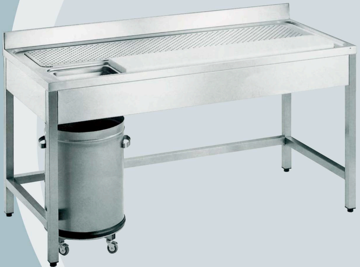
Tavolo Preparazione Carni